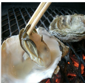
昼食は炭火焼海鮮バーベキュー